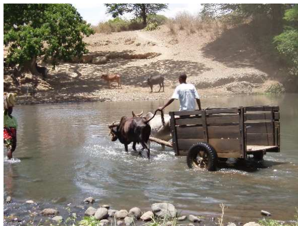
Så idyllisk kan det se ud. Masser af rindende vand, men det er ikke nemt, at få vandet ledet op til markerne.

PULS har været med til at give hjælp til selvhjælp til rigtig mange familier i disse områder, og vi forventer, at det, som er startet, vil brede sig. Bønderne kan nu lære af hinanden, og det er måske den allerbedste metode. PULS giver ikke mere økonomisk hjælp til områderne – i hvert fald ikke lige nu – selv om lederne tigger om det!