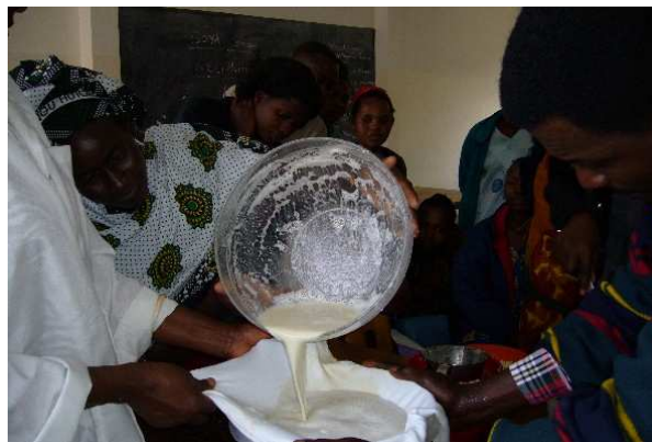
I skolen køkken undervises eleverne i fremstilling af sojamælk ved hjælp af simple redskaber.

Sojabønnen er en meget vigtig proteinkilde, og der er allerede lavet salgsaftaler med forskellige organisationer og institutioner. Der er også behov for at sprede kendskabet til sojamælk, og det hjælper vi bl.a. til med ved at undervise alle på madlavningskurserne i fremstilling af sojamælk og anvendelse af restprodukterne.