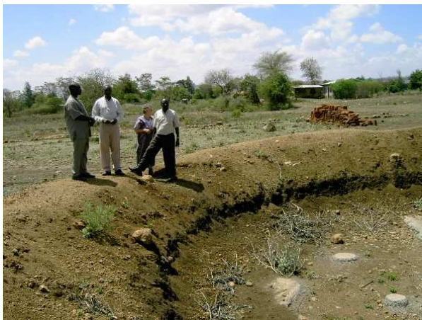
Dette tørre vandreservoir i Manyire kan nu fyldes med vand.

Vi vil også bringe en tak til RECODA for deres undervisning, som virkelig har givet os indblik i landbrugsmetoder, hvilket har bevirket, at vi nu høster mere end det dobbelte på vore små jordstykker.