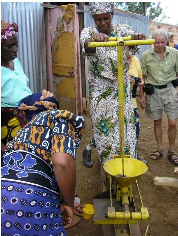
Her har en kvindegruppe i Manyire startet produktion af olie ved hjælp af en simpel presse. Et godt eksempel på, at kvinderne har en meget stor rolle i udviklingen.

Kommissionen skal komme med afrikanske løsninger på afrikanske problemer. Derfor kommer flertallet af kommissionens medlemmer fra Afrika.