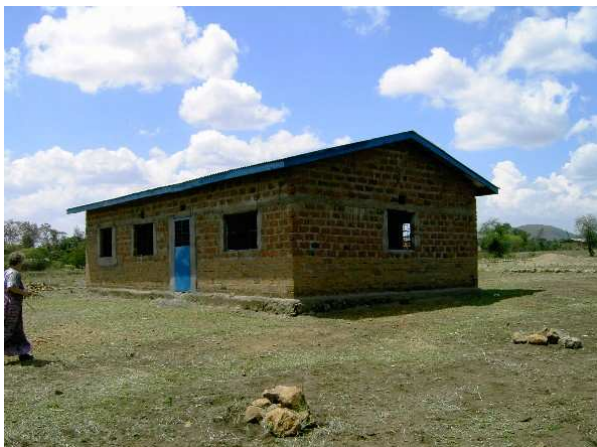
Her er den primitive landbrugsskole i Manyire. Der er planlagt en udvidelse med 2 mindre sovesale og et tidssvarende køkken. Begge tiltag vil øge anvendeligheden betydeligt.

Et kanalsystem med vand fra Kilimanjaro førte vandet gennem herremandens farm ud til Manyire området. Uden dette vand-system havde småbønderne ingen eksistensmuligheder. Den hvide farmer syntes, at han havde brug for alt vandet, derfor byggede han en dæmning og lukkede dermed af for Manyire området. Dette var ganske enkelt en katastrofe for de mange familier.