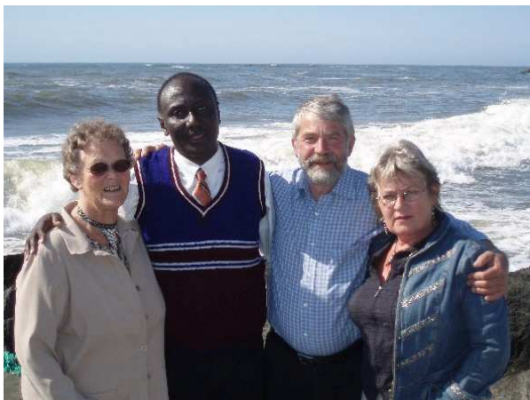
Et billede fra Ringos besøg i Danmark med Vesterhaver i baggrunden. Det er ikke hver dag, man ser haver, når man bor langt inde i Tanzania.

med få byggematerialer. Containeren kom til Tanzania uden problemer. Flere danske PULS-medlemmer har i årets løb besøgt HSH projekter i Tanzania og derefter givet udtryk for stor anerkendelse af arbejdet derude.