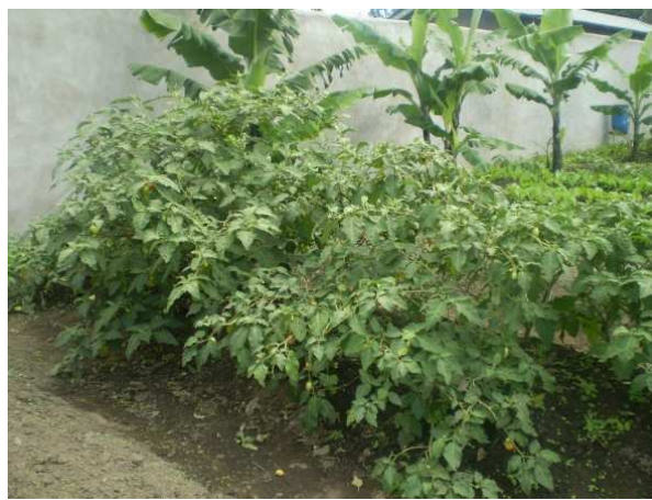
Haven i Sakina er blevet en stor succes. Her er det et nyt hold tomater, som pryder haven