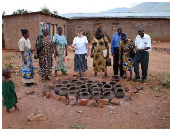
Et eksempel på en kvindegruppes initiativ. Her gælder fremstilling af lerkrukker

Udviklingsminister Ulla Tørnæs (V) vil have sat fokus på Afrika. Det skriver ministeren i en kronik i Politiken den 15. april.