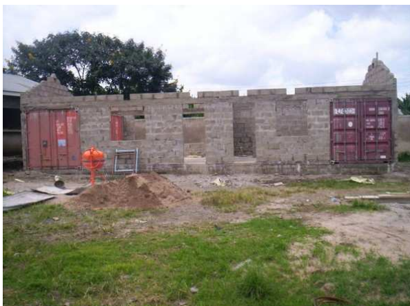
Her ses den halvfærdige bygning ved skolen i Sakina. Den skal danne rammerne om soja produktionen.

Efter flere års tilløb har vi nu startet et projekt med forarbejdning af sojabønner på skolen i Sakina. På skolens grund er en mindre bygning under opførelse. Her skal, med støtte fra Rockwool Fonden, etableres en produktion af sojaprodukter til brug for fremstilling af sojamælk.