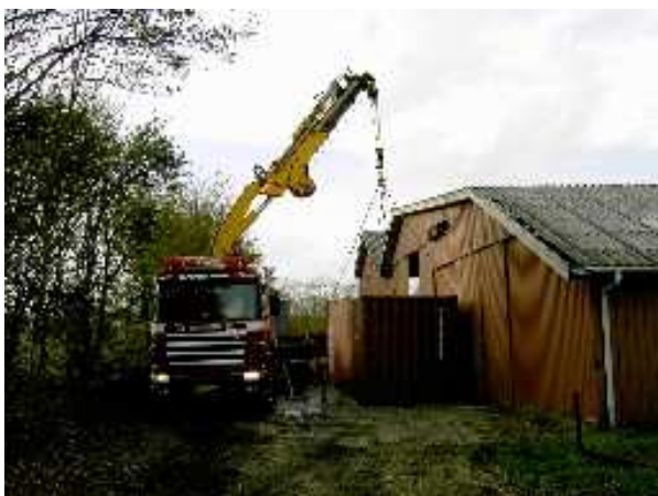
Her bliver en container afhentet ved vores lager i Herborg ved Videbæk. Det er ca. 13 ton, der skal løftes.

Lad mig gøre opmærksom på, at alle transportudgifter fra dør til dør samt containerne er betalt via en bevilling fra Danida, og sådan har det været, siden den første container blev sendt i 1989.