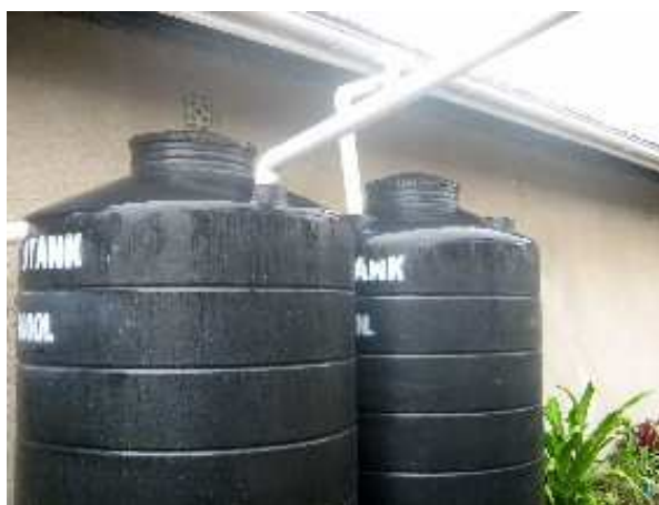
Billedet viser de 2 tanke, som tilsammen kan rumme 4.000 liter regnvand ved Teddys skole.

Teddys skole ligger i et slumområde, hvor der er en elendig vandforsyning. Der ER vandhaner, men kun vand én dag om ugen. De, som har penge, har installeret vandtanke, som på denne dag fyldes op. Vi har selvfølgelig sørget for vandtanke til skolen, men fattigfolk – og dem er der flest af – de har store problemer. En skiden rende med vand løber gennem bydelen. Værre kan det ikke være. Der drikker og skider gederne. Der vasker de fattige tøj og henter vand til forbrug. Det påvirker sundheden. Så det er da godt, at Teddy underviser i, at vandet skal koges.