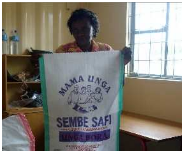
Der er sørget for professionel emballage til produkterne fra sojasmøllen i Sakina. Her en sæk til majs mel.

Det er et rigtig spændende projekt, som alle HSH-folk forventer sig meget af. Vi regner med, at dette projekt bliver en indkomstskabende aktivitet for HSH.