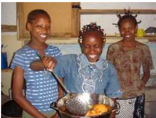
Her koges Mandasi. Det er en mellemtid mellem en æbleskive og en berliner. Den smager pragtfuldt.

kultur. Jeg vil ikke sige, at jeg fik et chok, for vi havde været i Afrika noget tid og havde derfor oplevet kulturen, men det var nu alligevel anderledes at komme helt tæt på.